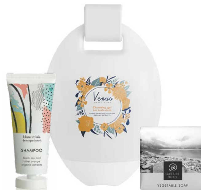
CUSTOMIZATION WITH CUSTOM COLOURS

*Some options are subject to additional surcharges and MOQ.