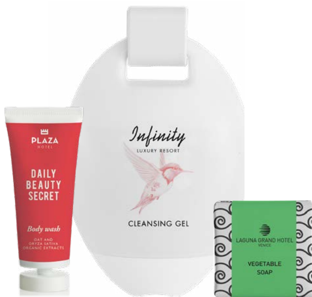
CUSTOMIZATION WITH SAME RANGE COLOURS

*This option is subject to a surcharge. See price list for details.